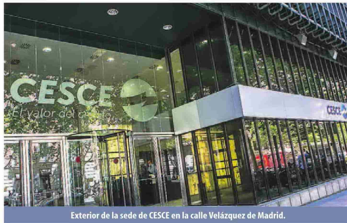
Exterior de la sede de CESCE en la calle Velázquez de Madrid.

CESCE tiene como principal objetivo aportar seguridad a los intercambios comerciales por medio de la gestión integral del crédito comercial, la información y la tecnología, por lo que desarrolla tres importantes líneas de actividad: ofrece soluciones transversales de crédito y de