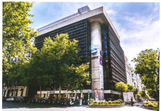
Sede de CESCE en Madrid

En los últimos años, CESCE ha pasado de ser una aseguradora de crédito tradicional a una consultora que acompaña a las empresas a lo largo de su ciclo de negocio, asesorándolas en materia de riesgos comerciales, en acceso a distintos canales de financiación, en recuperación de impagos y en la búsqueda de clientes solventes. Esta última herramienta de prospección comercial es proporcionada por la compañía gracias a la información comercial y financiera de empresas a nivel nacional e internacional que gestiona su filial, Informa D&B. En su transformación, CESCE se ha apoyado en la tecnología y ha evolucionado al ritmo que lo hacían las necesidades de sus clientes para ofrecerles soluciones generadoras de valor.